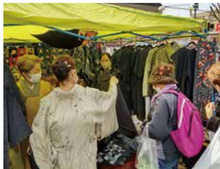
にぎわう時代着物市

すぐにお召しいただける着物から、材料布までお手頃価格の店が並びます。もちろん飲食テントも盛りだくさん。