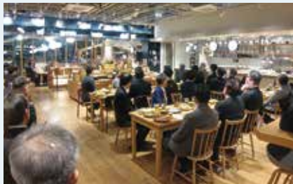
角川食堂にて新年祝賀会の様子

例会後に行われた新年祝賀会では、ご来賓の方々や青年部歴代会長、OB・OG会員、現役メンバーと交流を深めることができ、良い1年のスタートを切ることができました。